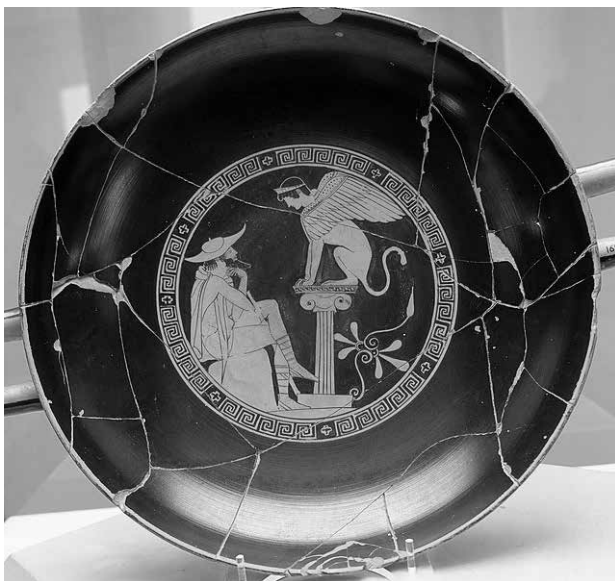
Oidipus och Sfinxen.